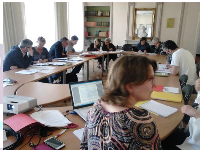
Le groupe, élus et techniciens, lors d'une séance de travail

Tempo Territorial – Rennes Métropole – Sce Prospective, Bureau des Temps – Rennes.