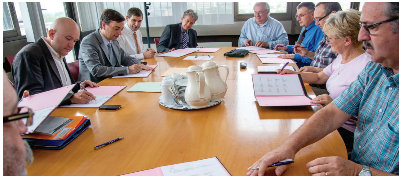
Signature du protocole d'accord local télétravail, le 4 juin 2014

Son lancement a fait l'objet de la signature en juin 2014 d'un Protocole d'accord local avec sept organisations syndicales sur les neuf, qui contractualisait les modalités pratiques (processus de candidature, critères d'éligibilité, forfait journalier, convention,...)