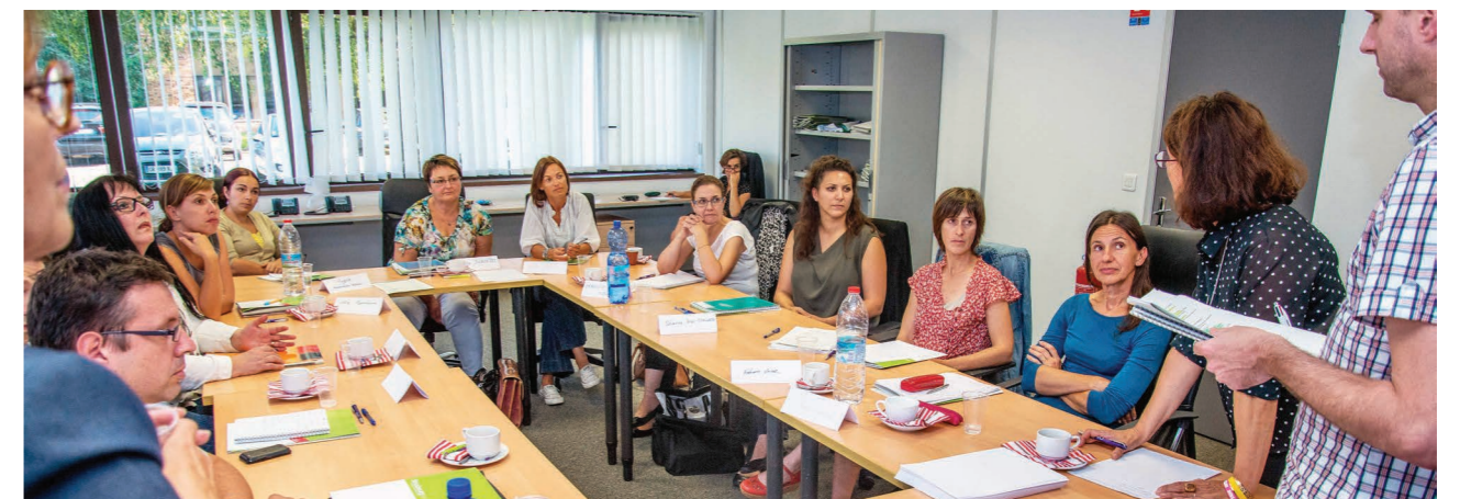
Une session de formation

Autre condition pour télétravailler : que les tâches à réaliser à distance aient été clairement identifiées par l'agent-e et validées par son encadrant-e.